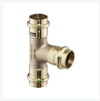
Sanpress-T-Stück mit SC-Contur Modell 2218 Artikel 121 754