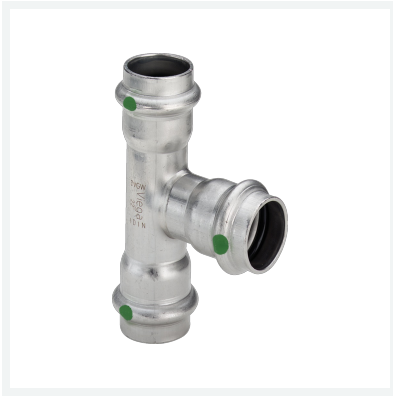
Sanpress Inox-T-Stück mit SC-Contur Modell 2318 Artikel 435 868