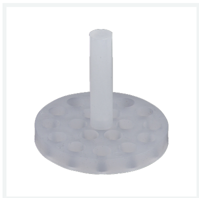
Siebeinsatz Modell 7964-563