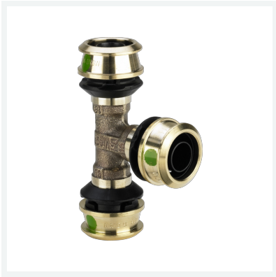
Raxofix-T-Stück mit SC-Contur - Pressanschlüsse Modell 5318