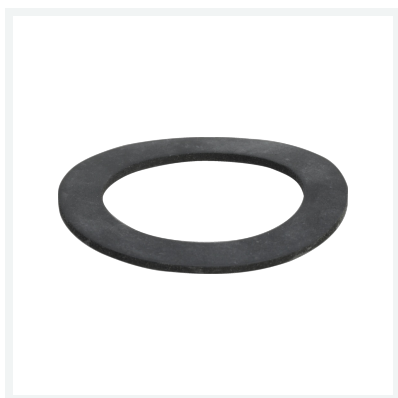
Dichtung Modell 9953