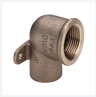
Wandscheibe Modell 94472G Artikel 113 490