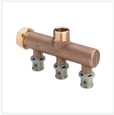
Sanfix P-Verteiler mit SC-Contur Modell 2126.07 Artikel 309 206