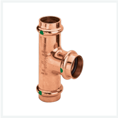
Profipress-T-Stück mit SC-Contur Modell 2418 Artikel 291 990