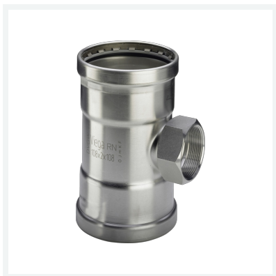
Sanpress Inox XL-T-Stück mit SC-Contur Modell 2317.2XL Artikel 578 145