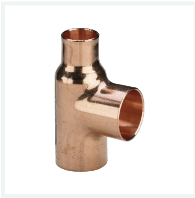
T-Stück Modell 95130 Artikel 118 556