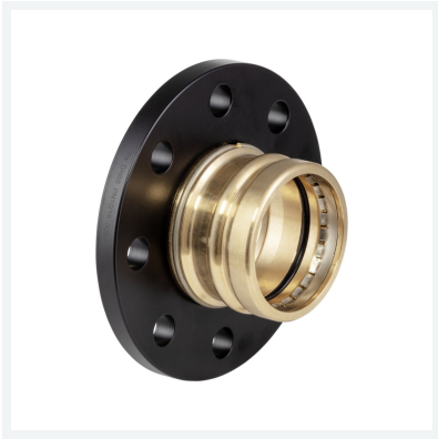
Sanpress XL-Flanschübergang mit SC-Contur Modell 2259.5XL Artikel 479 954