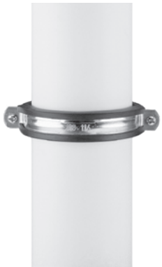
Rohrschelle mit Einlegeband als Losschelle