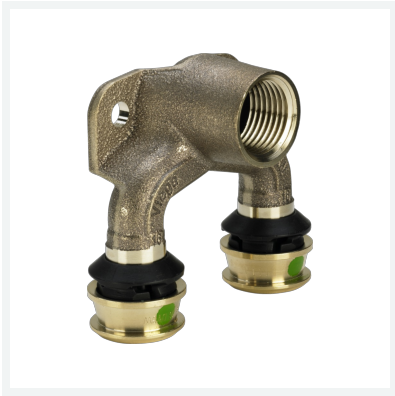
Raxofix-Doppelwandscheibe mit SC-Contur Modell 5325.7 Artikel 645 960