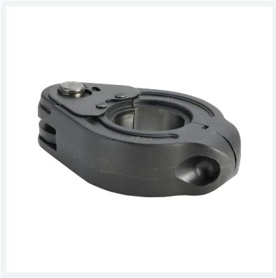
Pressring für Megapress Modell 4296.1