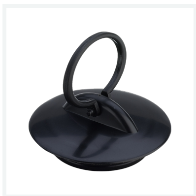
Ventilstopfen Ausstattung Schlüsselring Modell 9934.31