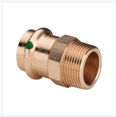
Sanpress-Übergangsstück mit SC-Contur Modell 2211 Artikel 283 490