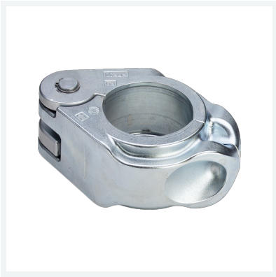
Pressring für Geopress Modell 9696.1