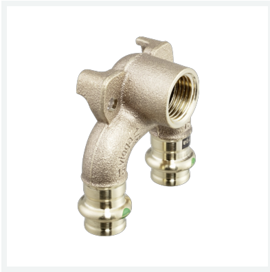
Sanpress-Doppelwandscheibe mit SC-Contur Modell 2228.7 Artikel 687 908