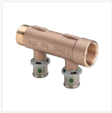
Sanfix P-Verteiler mit SC-Contur Modell 2126.06 Artikel 309 237