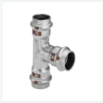
Temponox-T-Stück mit SC-Contur Modell 1718 Artikel 810 481