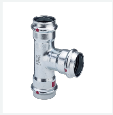
Prestabo-T-Stück mit SC-Contur Modell 1118 Artikel 642 549