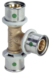
Sanfix P-T-Stück mit SC-Contur - Pressanschlüsse Modell 2118