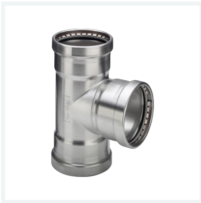
Sanpress Inox XL-T-Stück mit SC-Contur Modell 2318XL Artikel 482 787