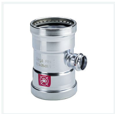
Prestabo XL-T-Stück mit SC-Contur Modell 1118XL Artikel 597 993