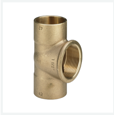
T-Stück Modell 94130G Artikel 152 734