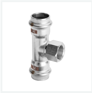
Temponox-T-Stück mit SC-Contur Modell 1717.2 Artikel 810 887